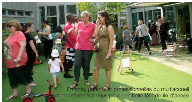
Enfants, parents et professionnelles du multiaccueil se sont donné rendez-vous pour une belle fête de fin d'année

Le mercredi 4 juillet pour clôturer l'année scolaire de façon festive, nous avons convié les parents à un goûter !