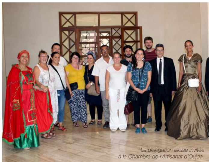
La délégation lilloise invitée à la Chambre de l'Artisanat d'Oujda.

Cette association travaille sur les mêmes valeurs que la Mode a du Cœur : permettre à des personnes en précarité, isolées ou à de jeunes talents de valoriser leurs potentiels et créativité. Chaque année, cette association organise le Festival Blouza , bien connu au Maroc.