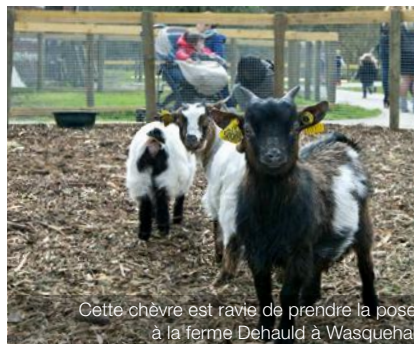
Cette chèvre est ravie de prendre la pose à la ferme Dehauld à Wasquehal.

C'est sur ! Nous nous retrouverons l'année prochaine pour une autre fête de fin d'année.