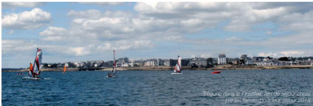
Trégunc dans le Finistère, lieu de séjour choisi par les familles pour leur séjour 2018

Chaque année au mois de novembre-décembre, le secteur Adultes/Familles du Centre Social et Culturel Lazare Garreau propose à une dizaine de familles d'effectuer un séjour estival.