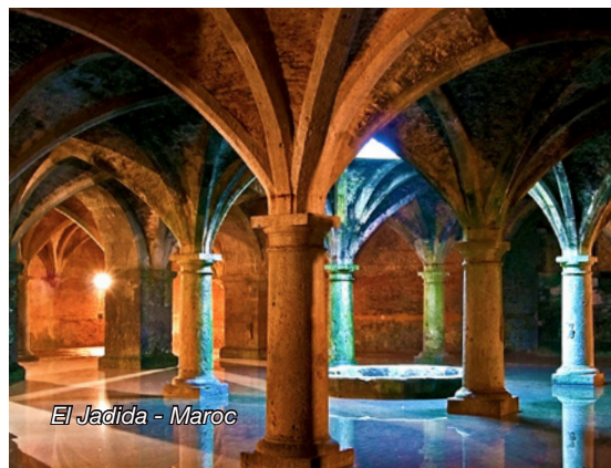
El Jadida - Maroc